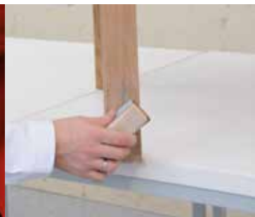
PRZESZLIFOWAĆ ZARYSOWANE POWIERZCHNIE