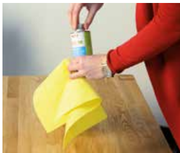
NAKŁADAĆ CIENKĄ WARSTWĄ